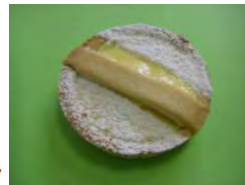
Crostatina crema vaniglia