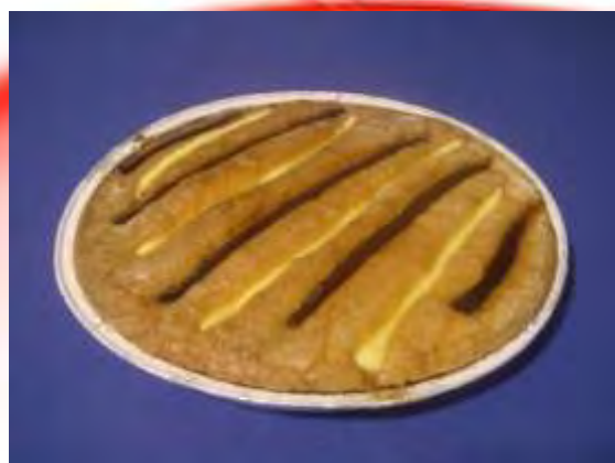
Crema e marmellata sottobosco