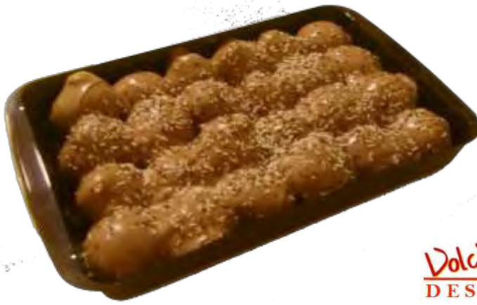
Profitterol scuro in vassoio