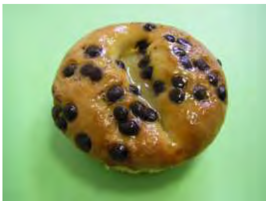
Pera cioccolato morbida