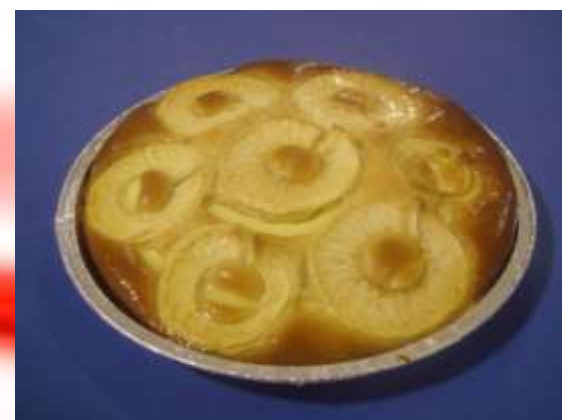
Mela a rondelle