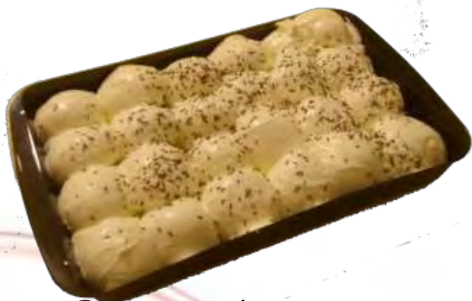
Profitterol chiaro in vassoio