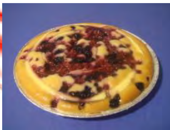
Crema e sottobosco a pezzi