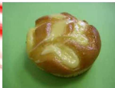
Limone e crema morbida