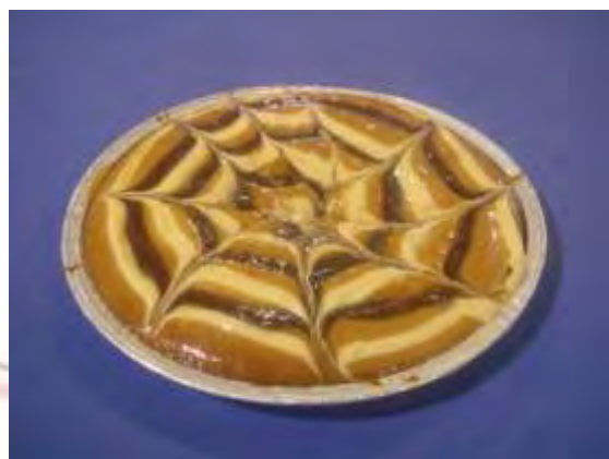
Crema marmellata ciliegia