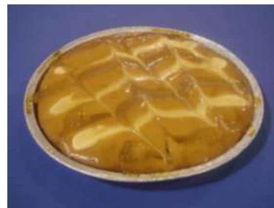
Crema e marmellata limone