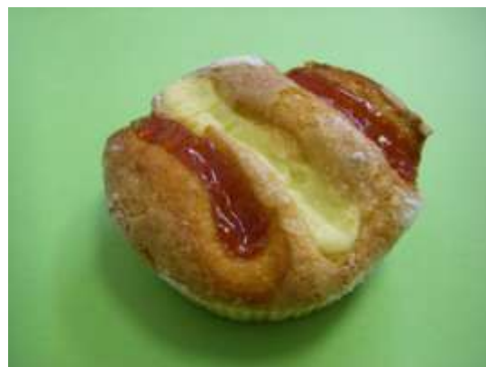
Variegata ciliegia e crema