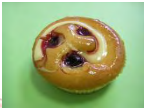
Ciliege e crema morbida