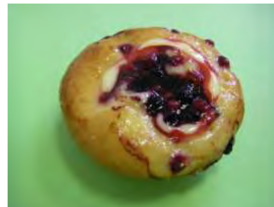
Sottobosco e crema morbida