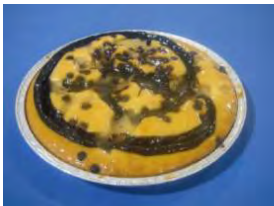
Pera e ciok con gocce di ciok