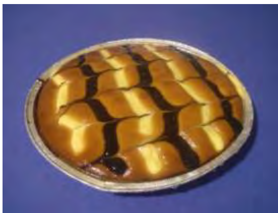
Crema e ciok