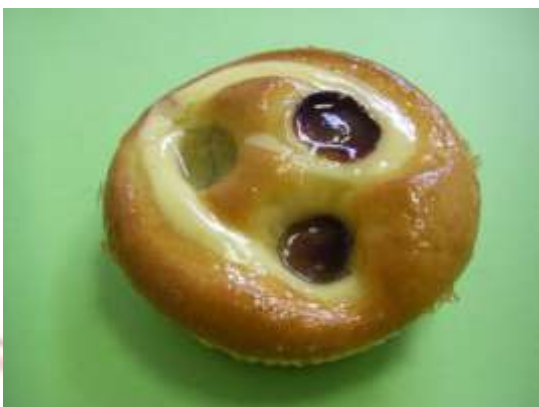
Uva e crema morbida