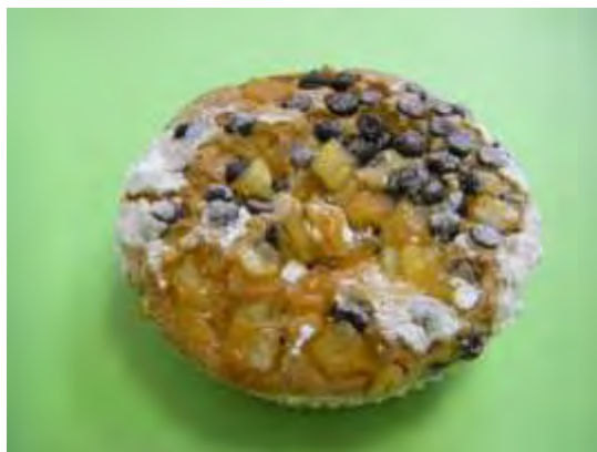
Scorze d'arancio e cioccolato