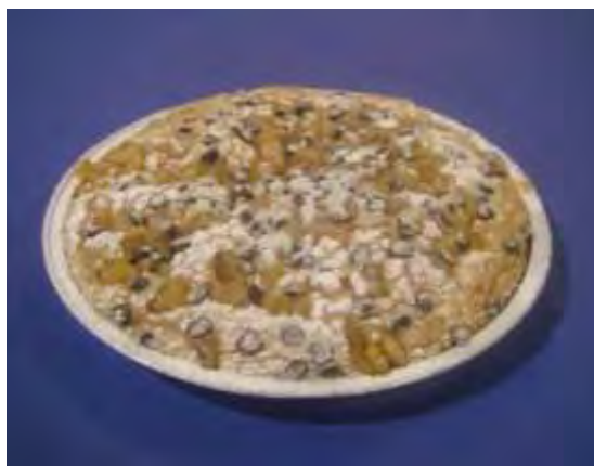
Torta arancio e ciok