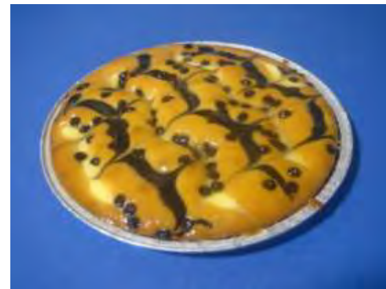
Crema e ciok con gocce